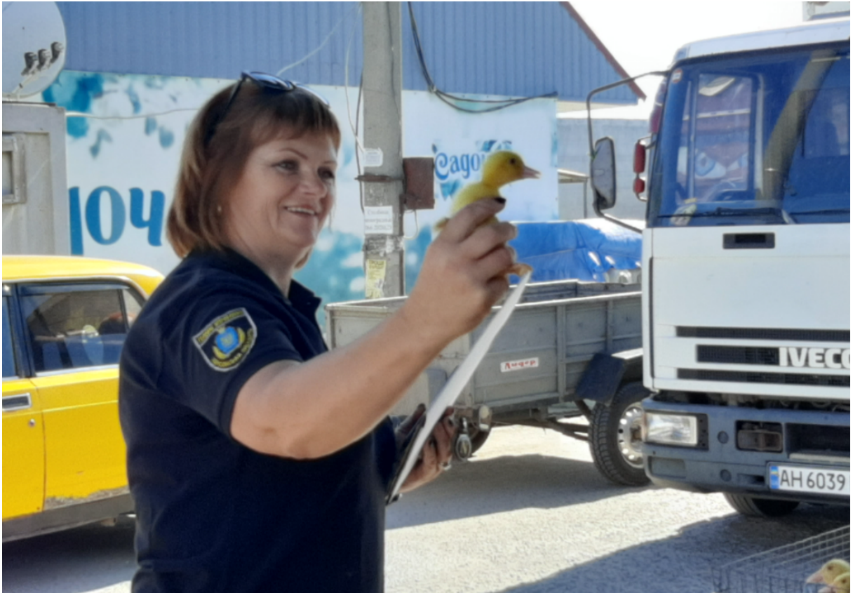
Кадр з телерограми «Шерифи для нових громад».