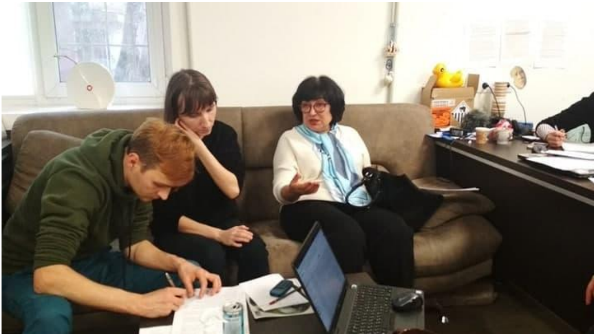
Робоча нарада команди Медіаплатформи «Вгору».

Проте протистояння ще не закінчилося. Як нам стало відомо, 28 грудня минулого року апеляційну скаргу подали також інші фігуранти справи - покупці приміщень з вищезгаданого переліку. «Вгору» продовжує слідкувати за подіями та вести інформаційну кампанію.