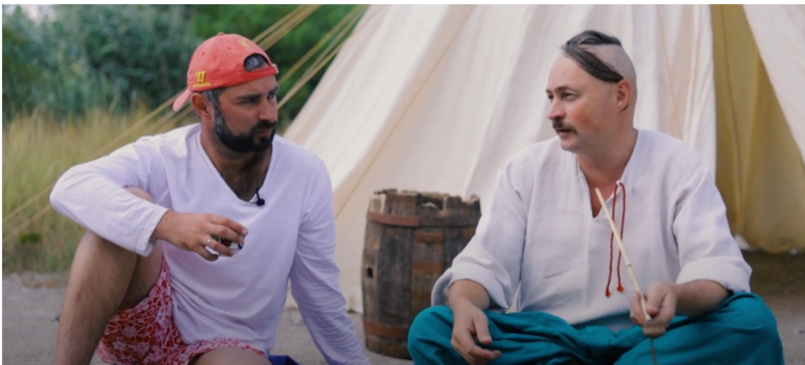
Кадр із 3го випуску тревел-шоу “Поїхали далі”.

З червня по жовтень 2020 року командою “Вгору” та партнерами з Першої Херсонської кіношколи було створено тревел-шоу “Поїхали далі” за підтримки Фонду Томсон Ройтерз (проект з розвитку незалежних медіа) та місцевого бізнесу. Для команди цей проект став першим досвідом реалізації такого масштабного відео проекту, а також по залученню коштів від бізнесу.