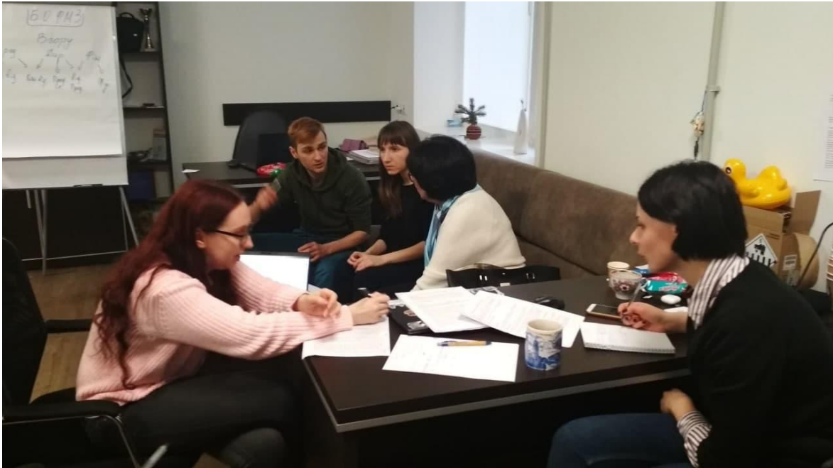
Стратегічне планування редакції "Медіаплатформи "Вгору".